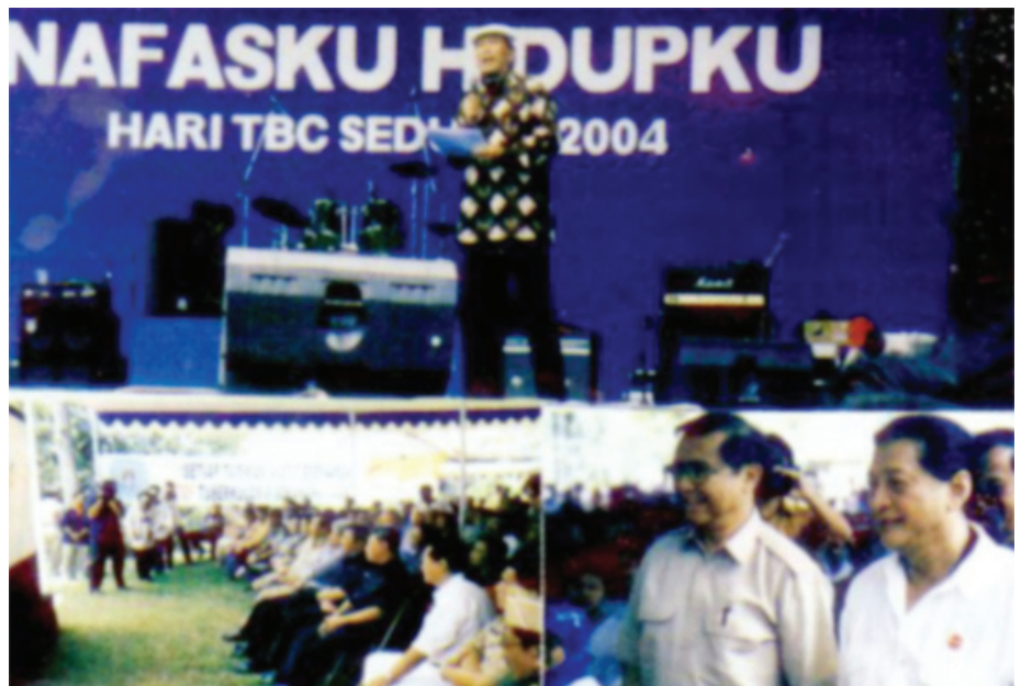
In Memoriam W.S Rendra 7 Agustus 2009

Setelah sekitar 7-8 tahun Bengkel Teater Rendra tinggal menetap di Desa Cipayung Jaya, Kota Depok, para anggotanya yang terlatih untuk peduli lingkungan mendapatkan temuan “besar” di masyarakat, ialah: rata-rata penduduk tidak bersekolah tinggi. Usia menikah pada masyarakat perempuan antara 12-15 tahun, biasanya dikawinkan